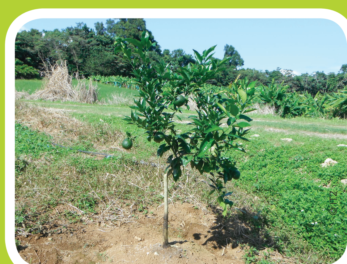
Plant au champ