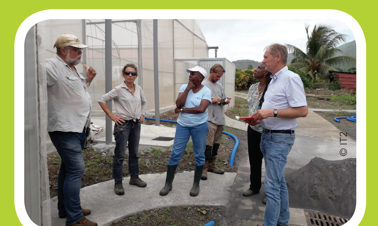
Mission d'appui à la certification par le SOC