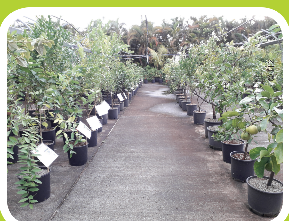
Plants de qualité prêts à être plantés