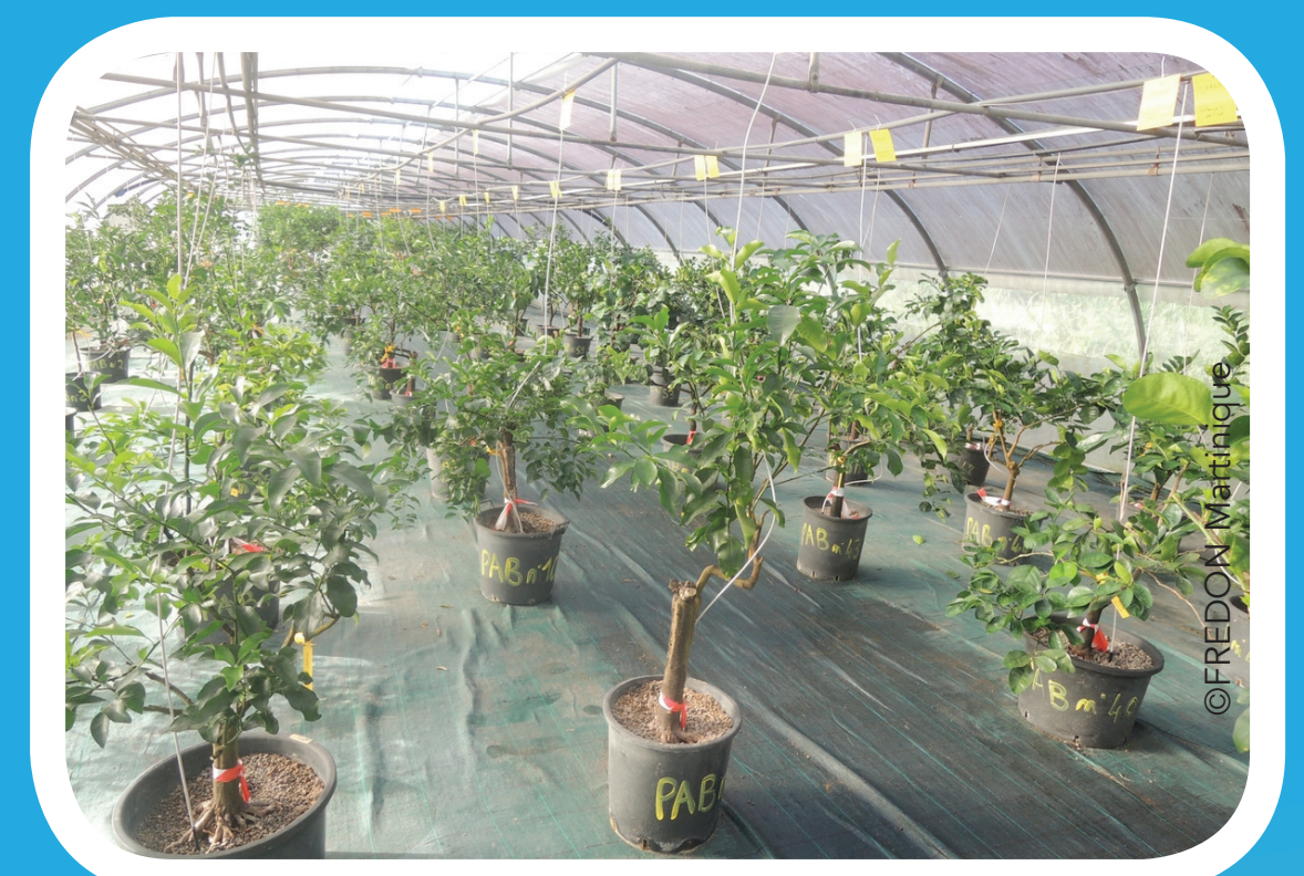
Parc à bois